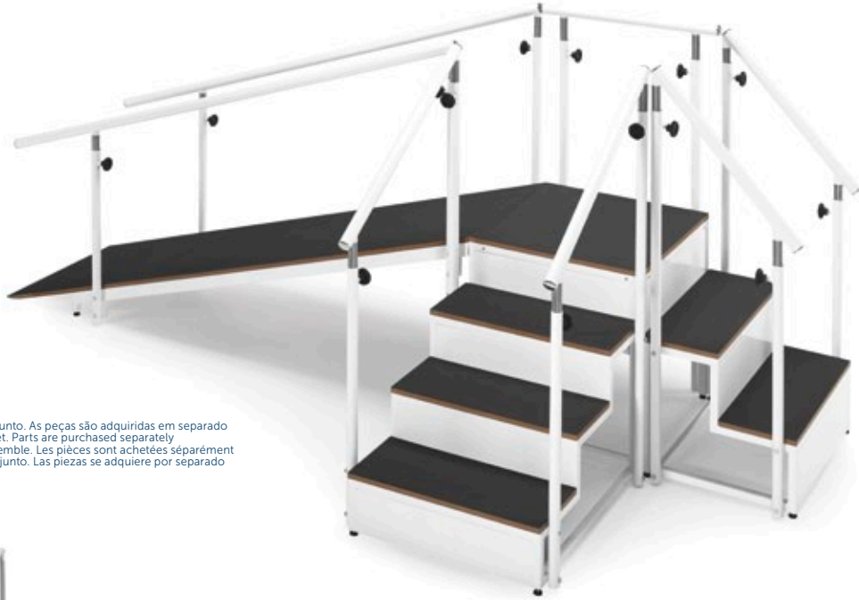
Imagem de conjunto. As peças são adquiridas em separado / Image of the set. Parts are purchased separately / Image de l'ensemble. Les pièces sont achetées séparément / Imagen de conjunto. Las piezas se adquiere por separado